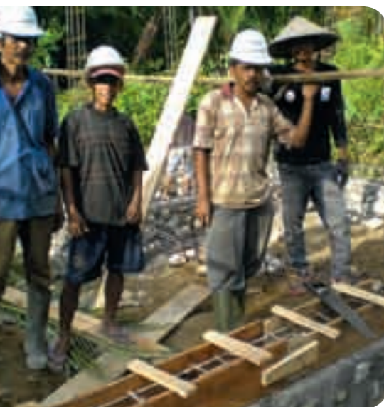
Herbouw van een polikliniek in het dorp Lembak Pasang in West-Sumatra

ramp zijn vooral de meest noodzakelijke benodigdheden verstrekt, zoals voedsel en water. Op dit moment is men vooral bezig met de wederopbouw van huizen en gebouwen. Getroffen gezinnen krijgen een nieuw, aardbevingsbestendig, huis met de mogelijkheid om het huis verder uit te bouwen, wanneer zij zelf daartoe in staat zijn. De bevolking in de regio wordt vanaf het begin betrokken bij de wederopbouw. Op die manier worden mensen geholpen om zelfstandig het leven weer op te pakken. Door uw bijdrage aan Luisterend Dienen worden de getroffen gezinnen geholpen om daar een begin mee te maken.