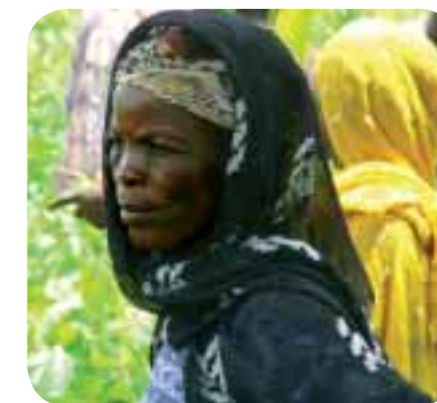
De Presbyteriaanse Kerk in Ghana helpt boerenfamilies.

Al jaren zet de Presbyteriaanse Kerk in Ghana zich in voor boerenfamilies. In de afgelopen drie jaar alleen al steunde de PCG meer dan 6000 boeren. De kerk helpt de boeren om samen te werken. Vaak is er sprake van verdeeldheid, maar als de boeren elkaar weten te vinden, kunnen ze landbouwkennis met elkaar delen en samen hun producten voor betere prijzen verkopen. De kerk brengt de boeren daarom samen in Farmer Based Organisations.